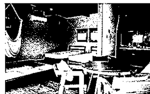
農園リゾートTHE FARMのコテージ