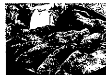
セコムの食「選べるギフト 彩」より